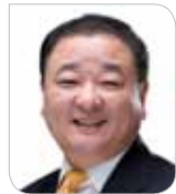
Kang Chang-il Member of National Assembly of the Republic of Korea 강창일 국회의원, 한일의원연맹 회장