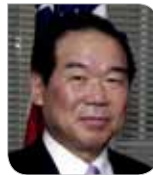
Fukushiro Nukaga Member of the House of Representative of Japan 누카가 후쿠시로 일본 중의원, 일한의원연맹 회장

김대중 대통령과 오부치 게이조 총리의 1998년 '21세기 새로운 한일 파트너십 공동선언'이 발표된 지 20년이 흐른 오늘날 한일관계는 어떠한 과제를 안고있는가? 양국 의원 및 각 분야 전문가들이 새로운 한일 공동선언 추진 방향에 대해 이야기한다.