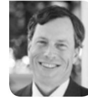
Philip D. Zelikow

White Burkett Miller Professor, University of Virginia/Former Counselor of the United States Department of State