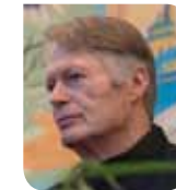
Jean-Marie Gustave Le Clézio

Writer, 2008 Nobel Laureate of Literature